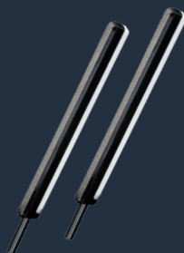
9990 max et Keramik- und Diamantstäbe Set