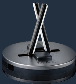
9990 max Messerschärfer